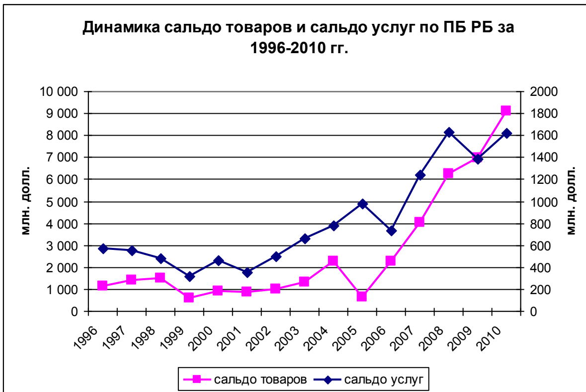
Рисунок 2. Динамика по годам сальдо товаров – по левой шкале, динамика сальдо услуг – по правой. Различие масштабов – в 5 раз. Для удобства сравнения на рисунке приведена абсолютная величина сальдо товаров.

Динамика сальдо доходов, приведенная в четвертом столбце таблицы 2, соответствует росту внешних заимствований в условиях недостаточного объема международных резервов. Достаточность здесь понимается в соответствии с международной практикой соотношения объемов международных резервов объему трехмесячного импорта, сложившегося за 12 предшествующих месяцев (рисунок 3).